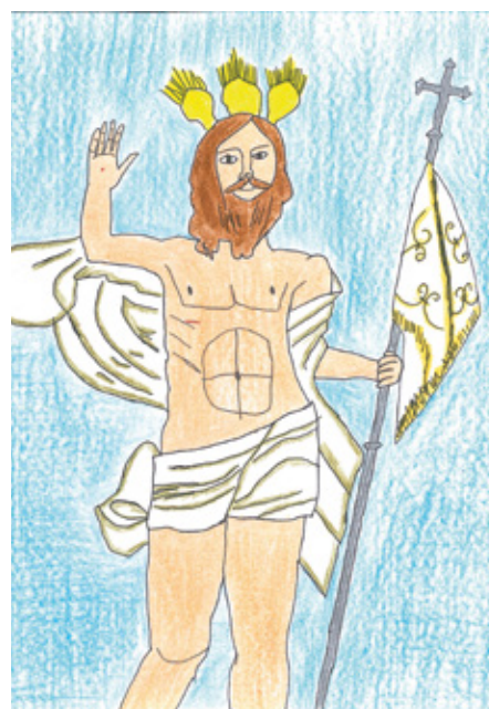
3º PREMIO MARÍO ZAMORA LEAL 6º E.P. -C.E.I.P. Poeta Molleja

Edita: Agrupación de Hermandades y Cofradías de Semana Santa de Villa del Río.