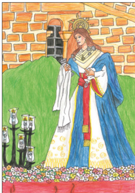
1º PREMIO CELESTE POLO ROJAS 5º E.P. - C.E.I.P. Poeta Molleja